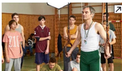
Tváří T-Mobilu je Ivan Trojan v roli učitele tělocviku

Digitální verzi letní kampaně pro T-Mobile bude opět zajišťovat Symbio Digital . Agentura zvítězila v interním tendru a bude vyvíjet bannerovou kampaň a navazující microsite.